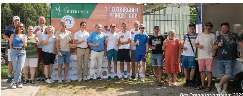
Das Organisationsteam 2025