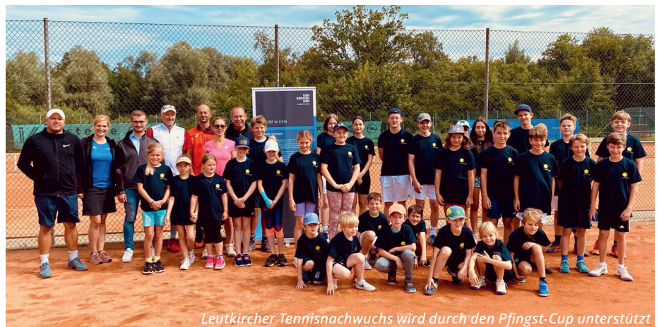
Leutkircher Tennisheldchen wird durch den Pfingst-Cup unterstützt